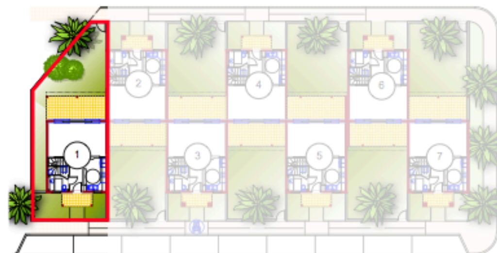
TABLEAU DES SURFACES VILLA N°1